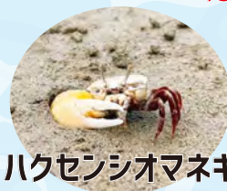
ハクセンシオマネキ